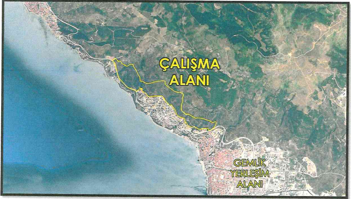
Planlama Alanın Konumu

Söz konusu parsellerin batısındaki Gemlik kent meydanına uzaklığı yaklaşık 2km'dir. Parsellerin batısındaki Gemlik sahiline mesafesi yaklaşık 2,2km güneyinden geçen Bursa-Yalova Karayolu'na mesafesi yaklaşık 400m'dir.